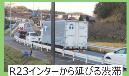
R23インターから延びる渋滞

一般質問 変化点を先取りした具体的対策および、県と連携した予防保全の推進や町から要望したものが先送りされずに実現するための取り組みはどのようか。