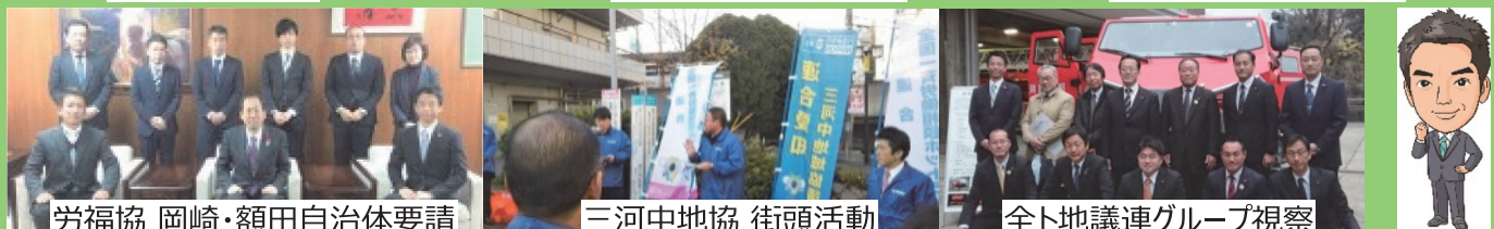
労福協 岡崎・額田自治体要請