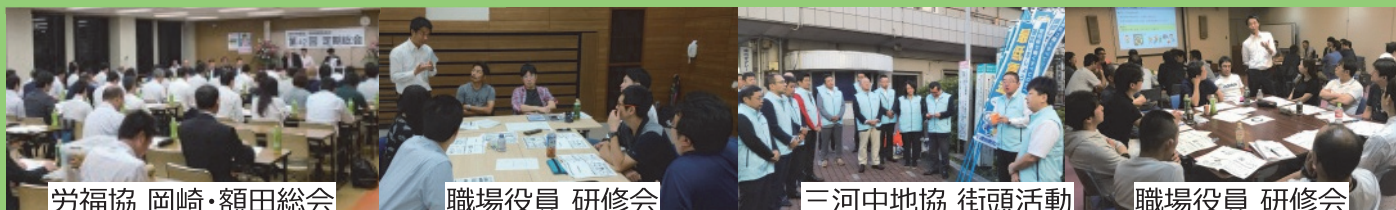
労福協 岡崎・額田総会