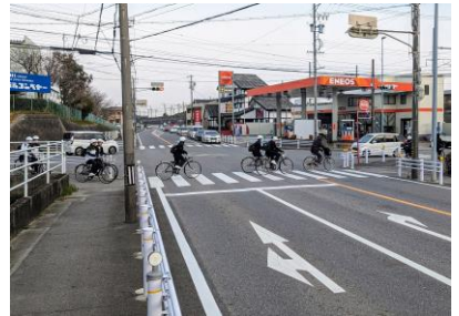
登校時の大迫交差点

総務部長▼優先度の高い交差点（通学路、歩行者数、交通事故等）から実施、9カ所の新規設置を要望、危険性高い交差点は通学路点検や地元要望により安全対策や警察へ要望、重大事故発生交差点は警察と道路管理者と防災安全課で現場検証し交通事故防止対策実施、課題は、県道であり退避場所等の民地確保、当面は反対側の通行を指導、防犯カメラの目的外利用は難しい、ゾーン30は対象区域内住民等の合意形成が課題。など