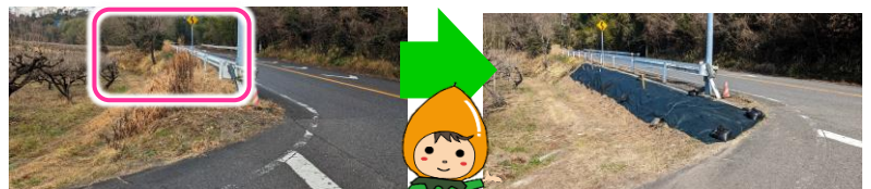
刈取り後、徐々に成長

都度打ち上げし、町から県へ要望していましたが、長期間管理可能な防草シート設置に改善されました。