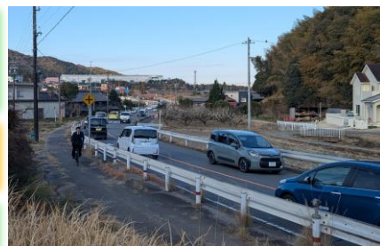
交通事故発生要因の交通集中