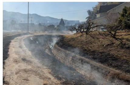
広範囲の草焼きで充満する煙

建設部長▶町の業者発注や親切作業班による草刈りに対応。草焼きに代わる良い方法がない。今後模索する。